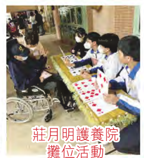
莊月明護養院攤位活動