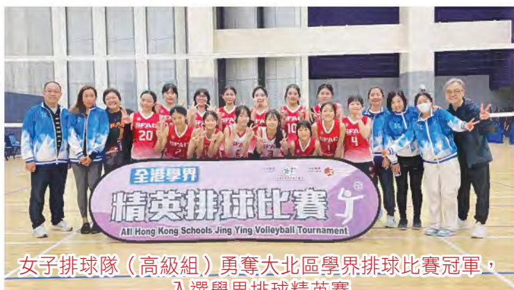
女子排球隊(高級組)勇奪大北區學界排球比賽冠軍，入選學界排球精英賽