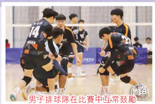
男子排球隊在比賽中互常鼓勵