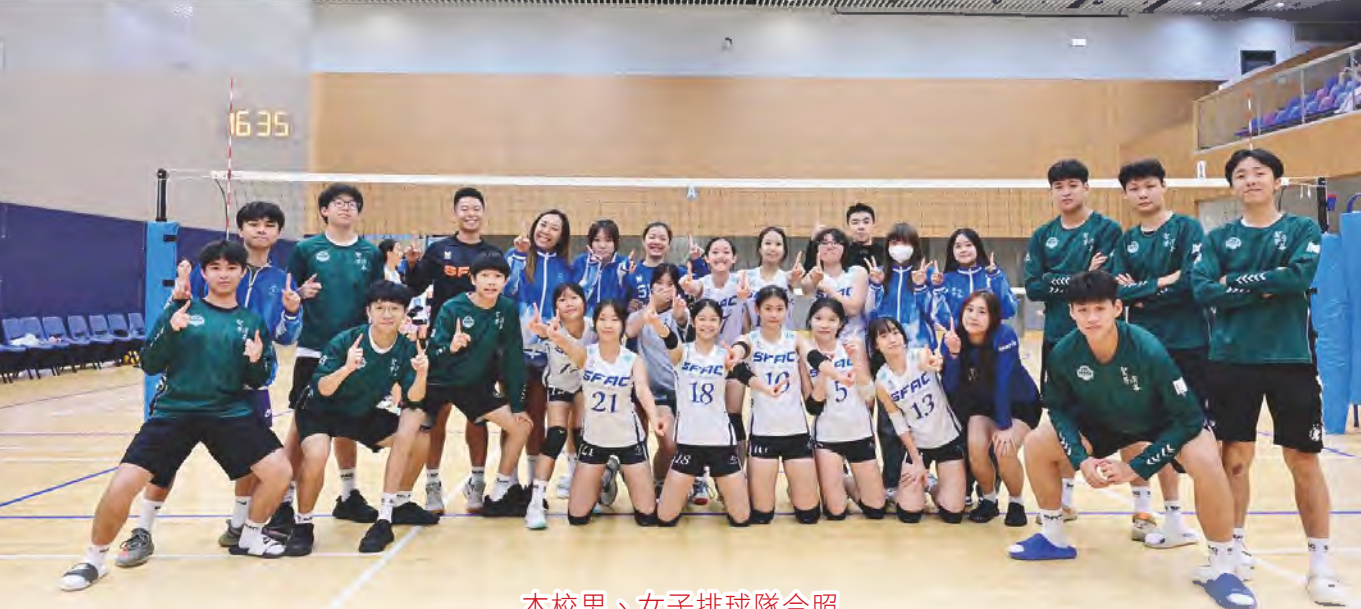
本校男、女子排球隊合照