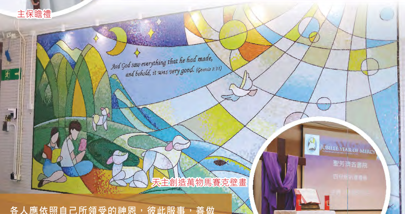
天主創造萬物馬賽克壁畫