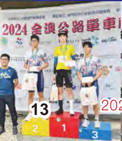
2024年澳門公路單車聯賽 第一場 勇奪公路賽U19組別亞軍及U16組別季軍