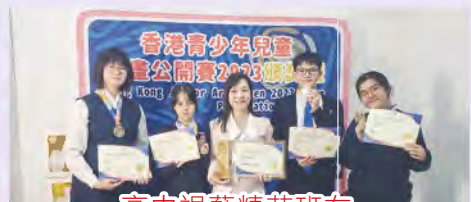
高中視藝精英班在 《香港青少年兒童繪畫公開賽2023》 「青少年組-1銀獎、3銅獎」及 「優質藝術教育大獎——銅獎」