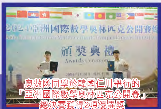
奧數隊同學於韓國仁川舉行的 「亞洲國際數學奧林匹克公開賽」 總決賽獲得2項優異獎