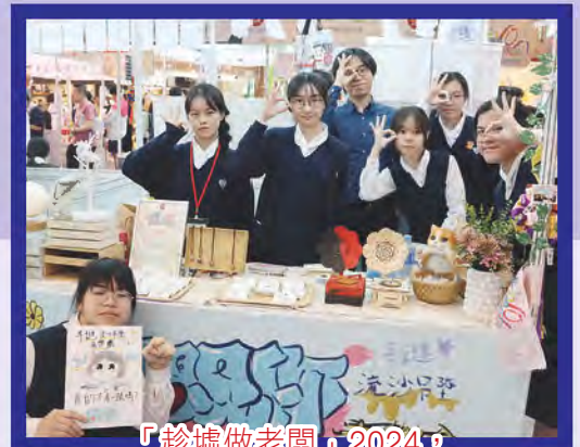
「趁墟做老闆」2024同學銷售精美商品