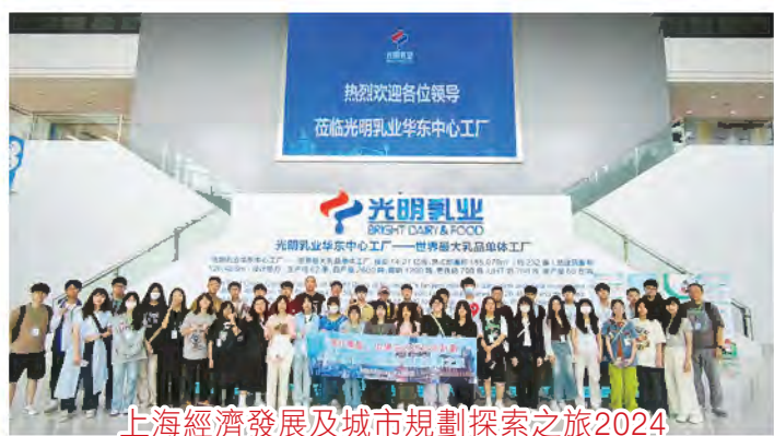
上海經濟發展及城市規劃探索之旅2024