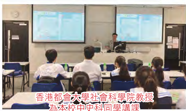
香港都會大學社會科學院教授 為本校中史科同學講課