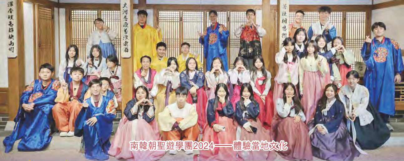
南韓朝聖遊學團2024——體驗當地文化