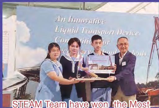
STEAM Team have won the Most Elegant Device Award in the Innovative Liquid Transport Device Competition for Secondary School Students