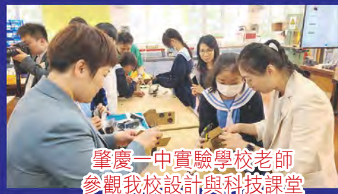
肇慶一中實驗學校老師 參觀我校設計與科技課堂