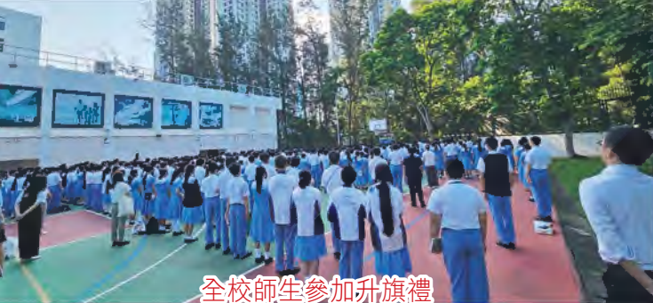
全校師生參加升旗禮