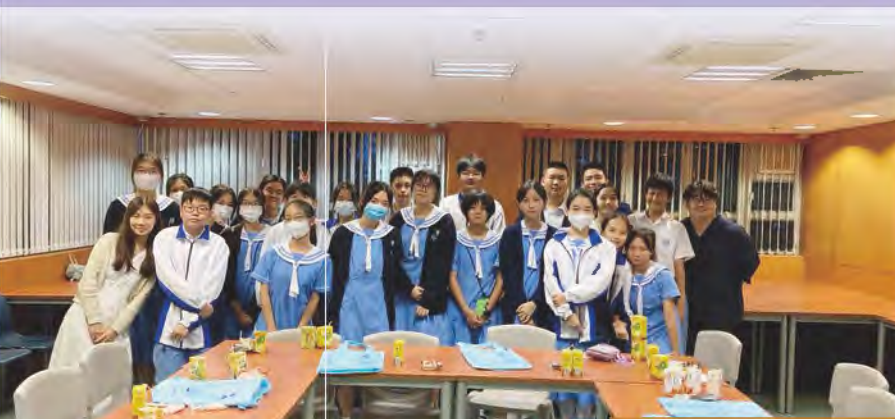
學校推廣大使訓練活動——由幹事會同學自行設計活動內容

本校著重培育學生的領袖才能、發揮所長，通過不同活動，例如學長訓練營、領袖訓練營、外間機構之領袖培訓活動和參與優秀學生選舉等，讓同學增廣見聞，擴闊視野。另一方面，本校亦會安排同學自行策劃活動或協助老師舉辦活動，以提升同學之領導能力，達至全人發展。