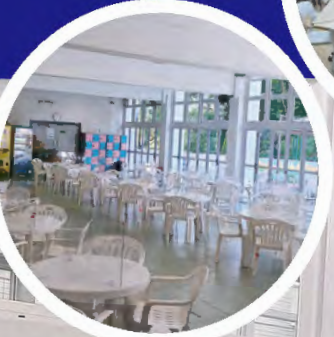
裝設冷氣的小賣部