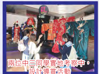
兩位中三同學實地考察中，設計導賞活動