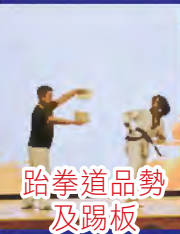
跆拳道品勢 及踢板