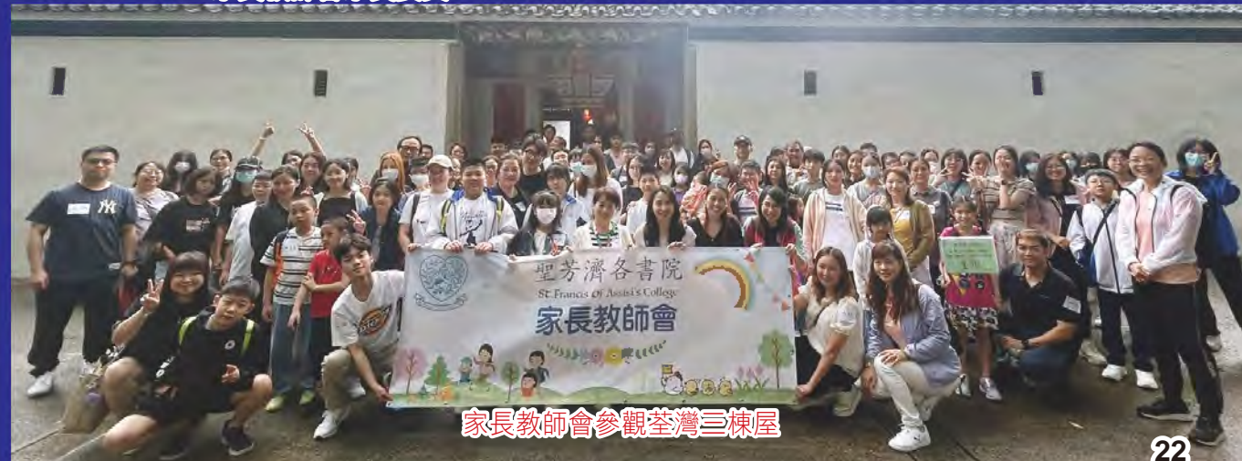
家長教師會參觀荃灣三棟屋