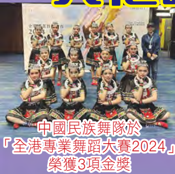
中國民族舞隊於 「全港專業舞蹈大賽2024」 榮獲3項金獎