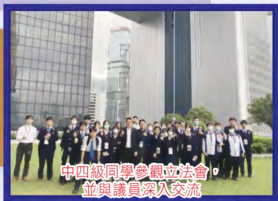
中四級同學參觀立法會， 並與議員深入交流