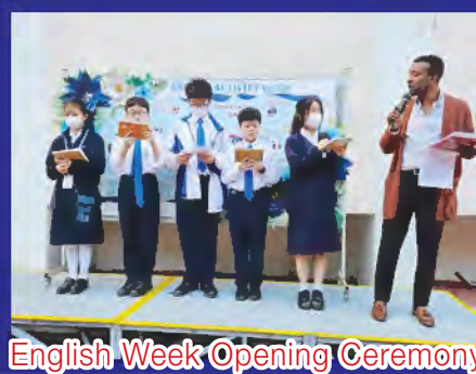
English Week Opening Ceremony