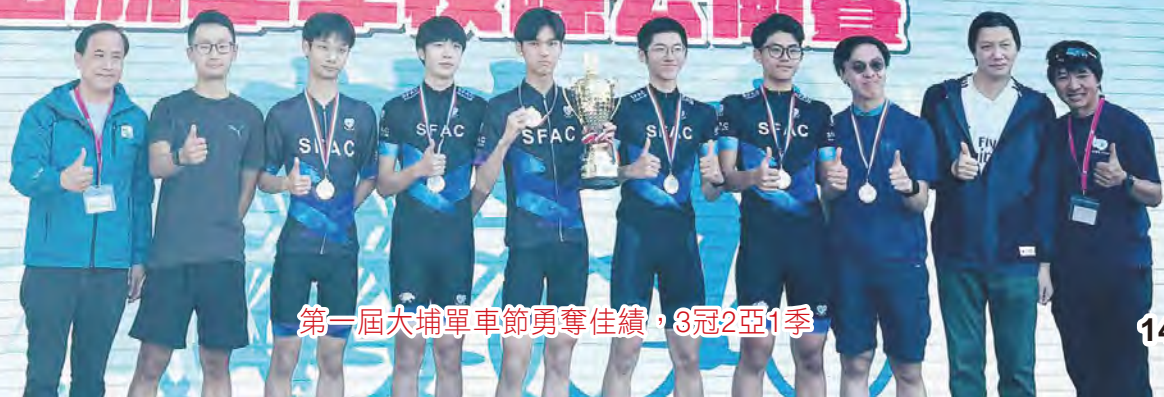
第一屆大埔單車節勇奪佳績，3冠2亞1季