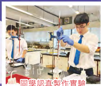
同學認真製作實驗