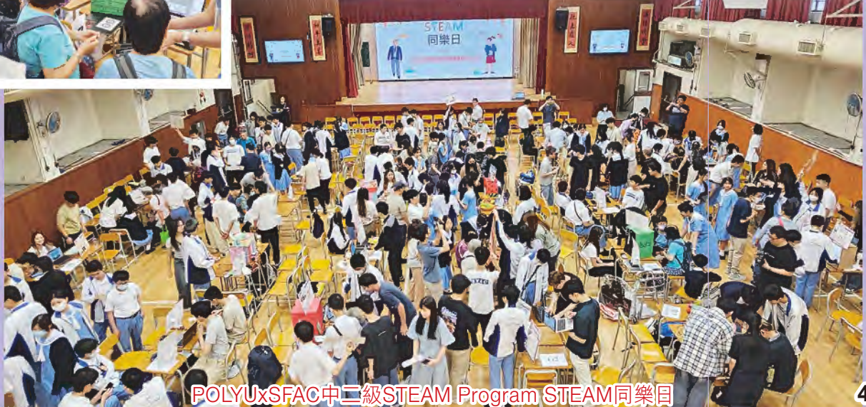
POLYU x SFAC 中二級 STEAM Program STEAM 同樂日