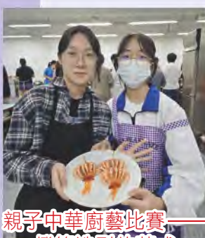
親子中華廚藝比賽—— 燈籠造型的菜式「喜慶團圓」