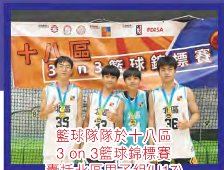
籃球隊於十八區 3 on 3籃球錦標賽 囊括北區男子組(U17) 冠、亞、季軍