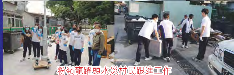
粉嶺龍躍頭水災村民跟進工作