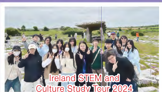
Ireland STEM and Culture Study Tour 2024