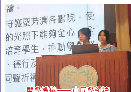
開學禮儀——由同學領禱