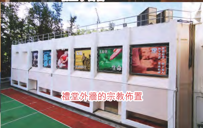
禮堂外牆的宗教佈置