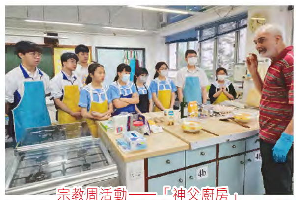
宗教周活動——「神父廚房」