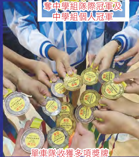
單車隊收獲多項獎牌