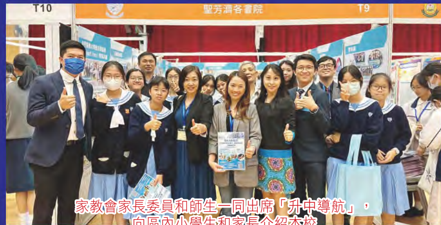
家教會家長委員和師生一同出席「升中導航」， 向區內小學生和家長介紹本校