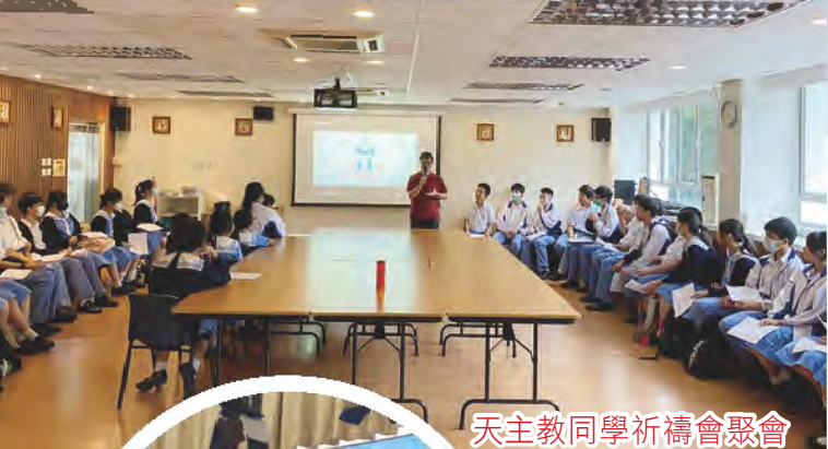
天主教同學祈禱會聚會