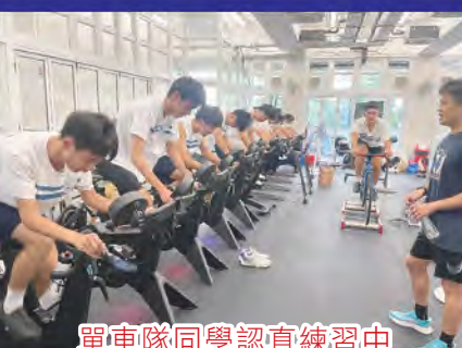
單車隊同學認真練習中