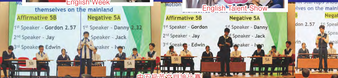
中五級英文辯論比賽