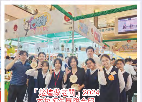
「趁墟做老闆」2024本校師生團隊合照