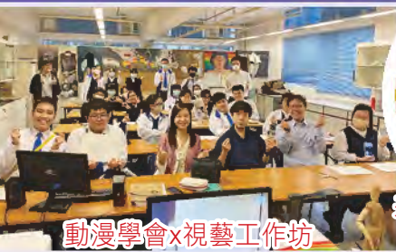
動漫學會x視藝工作坊