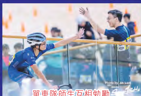
單車隊師生互相勉勵