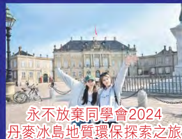
永不放棄同學會2024 丹麥冰島地質環保探索之旅