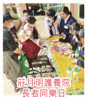
莊月明護養院長者同樂日