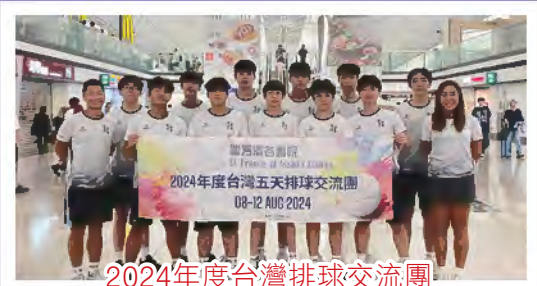
2024年度台灣排球交流團