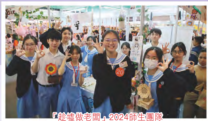
「趁墟做老闆」2024師生團隊