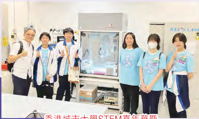
香港城市大學STEM嘉年華暨 學生專題研發展覽