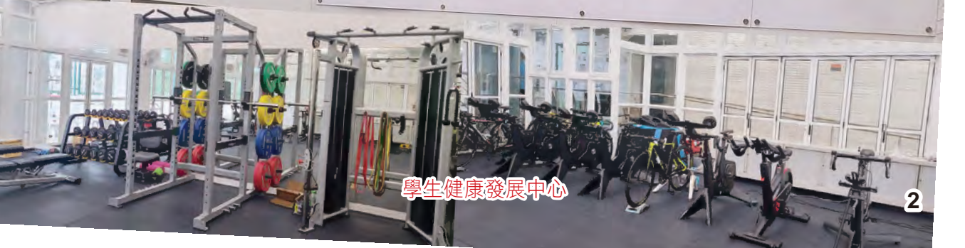
學生健康發展中心