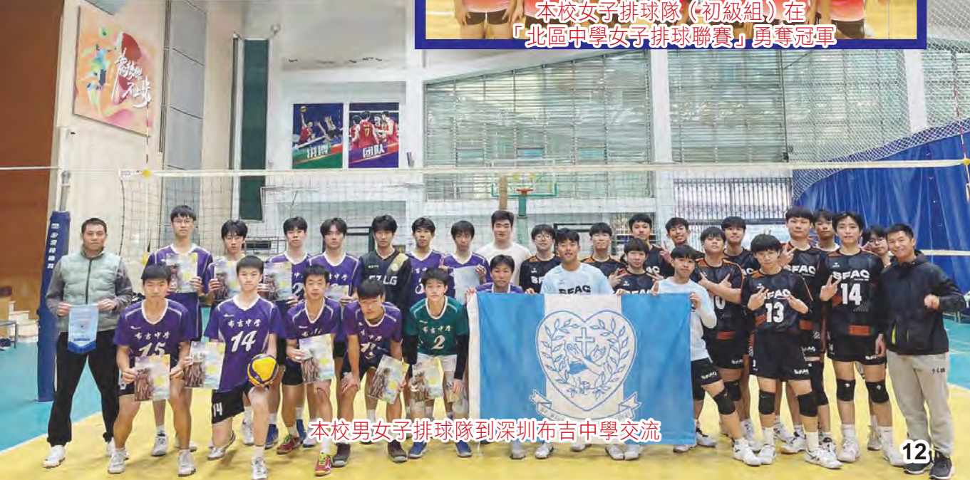
本校男女子排球隊到深圳布吉中學交流