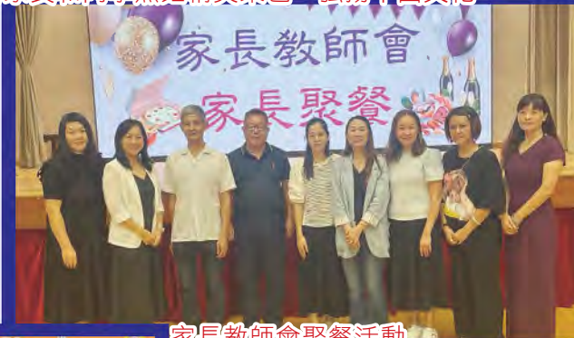
家長教師會聚餐活動

家長教師會是家長與學校溝通的橋樑，幫助家長及老師建立緊密的關係。因此，家長教師會每年都與學校合辦不同的活動，發揮「家校合作」精神。