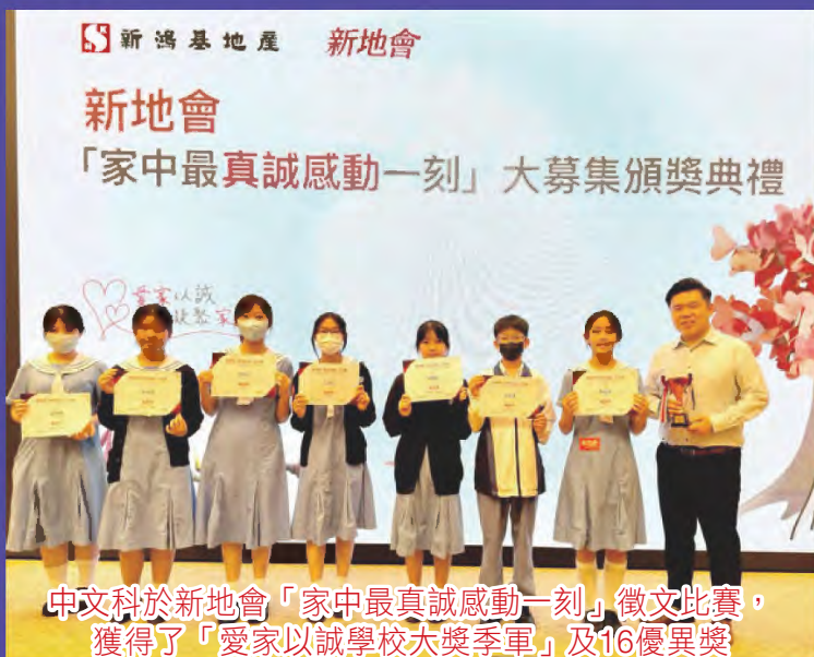
中文科於新地會「家中最真誠感動一刻」徵文比賽， 獲得了「愛家以誠學校大獎季軍」及16優異獎

本校十分重視同學的兩文三語，除課堂學習外，亦舉辦不同的活動培養同學的興趣。同時，學校推薦同學參加不同類型的比賽，豐富同學的學習閱歷，擴闊視野，提升學習讀寫聽說的能力，同學亦在各項比賽中獲得佳績。