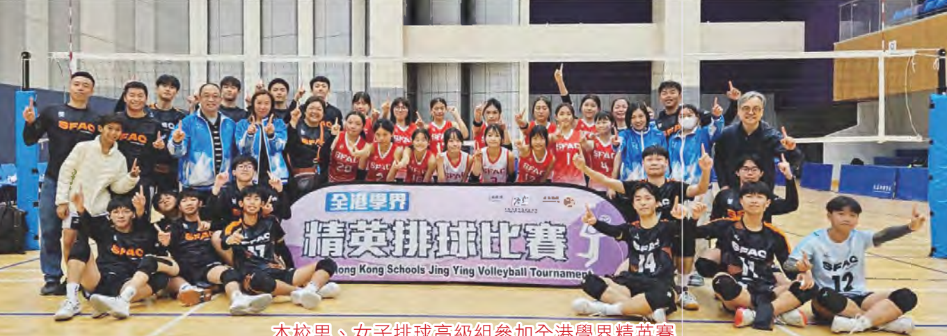
本校男、女子排球高級組參加全港學界精英賽