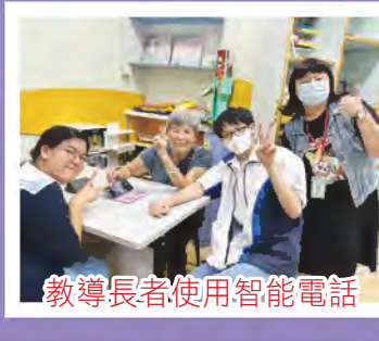
教導長者使用智能電話