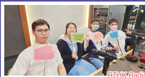
RTHK Radio programme