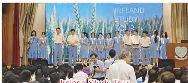
Ireland Study Tour