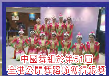
中國舞組於第51屆 全港公開舞蹈節獲得銀獎