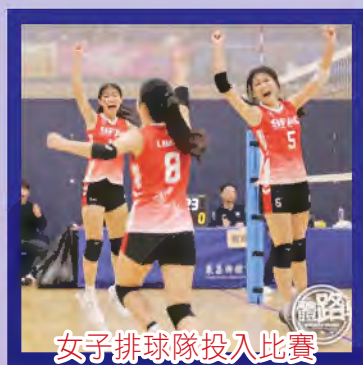
女子排球隊投入比賽