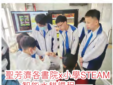
聖芳濟各書院x小學STEAM 智能水耕課程 本校同學指導小學生製作實驗