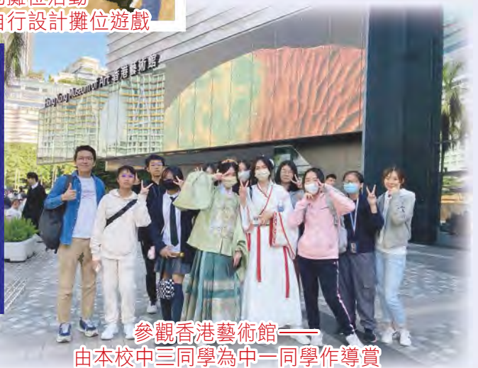
參觀香港藝術館——由本校中三同學為中一同學作導賞