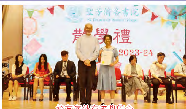
校友海外交流獎學金