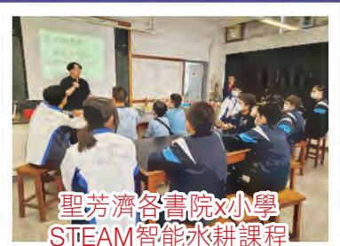
聖芳濟各書院x小學 STEAM智能水耕課程