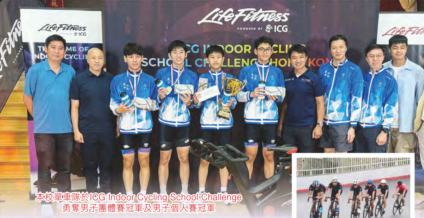
本校單車隊於ICG Indoor Cycling School Challenge 勇奪男子團體賽冠軍及男子個人賽冠軍