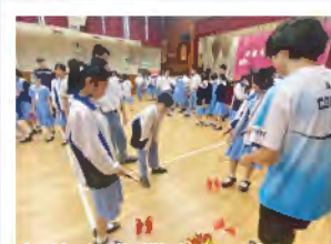
中華文化攤位活動—— 同學專注參與遊戲