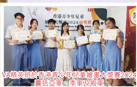
VA精英班於香港青少年兒童繪畫大獎賽2024 囊括亞軍、季軍及殿軍