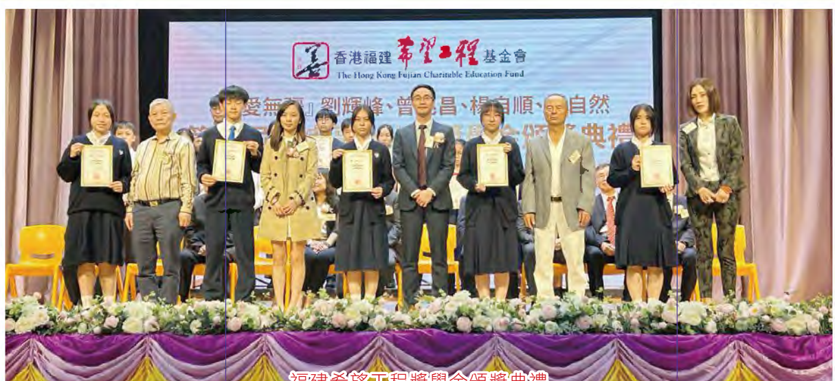
福建希望工程獎學金頒獎典禮