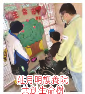
莊月明護養院共創生命樹