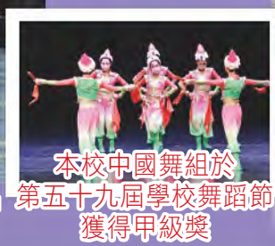
本校中國舞組於 第五十九屆學校舞蹈節 獲得甲級獎