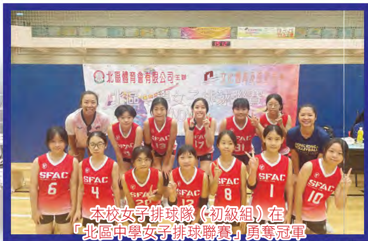
本校女子排球隊(初級組)在「北區中學女子排球聯賽」勇奪冠軍