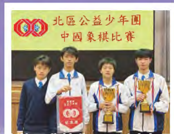
本校同學於北區公益少年團 中國象棋比賽奪得 初中組冠軍及高中組亞軍