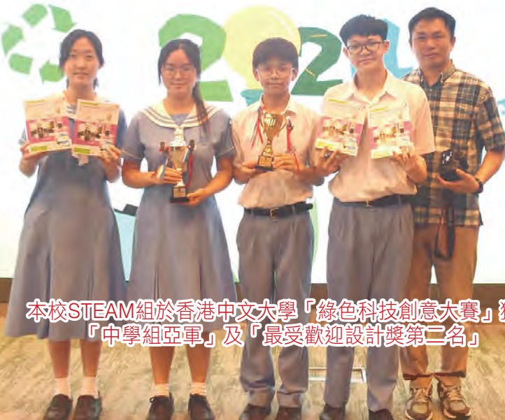
本校STEAM組於香港中文大學「綠色科技創意大賽」獲得 「中學組亞軍」及「最受歡迎設計獎第二名」