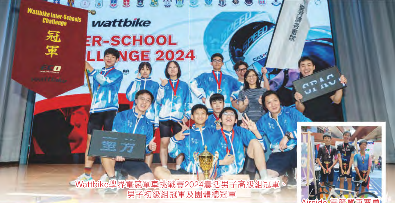
Wattbike學界電競單車挑戰賽2024囊括男子高級組冠軍、男子初級組冠軍及團體總冠軍