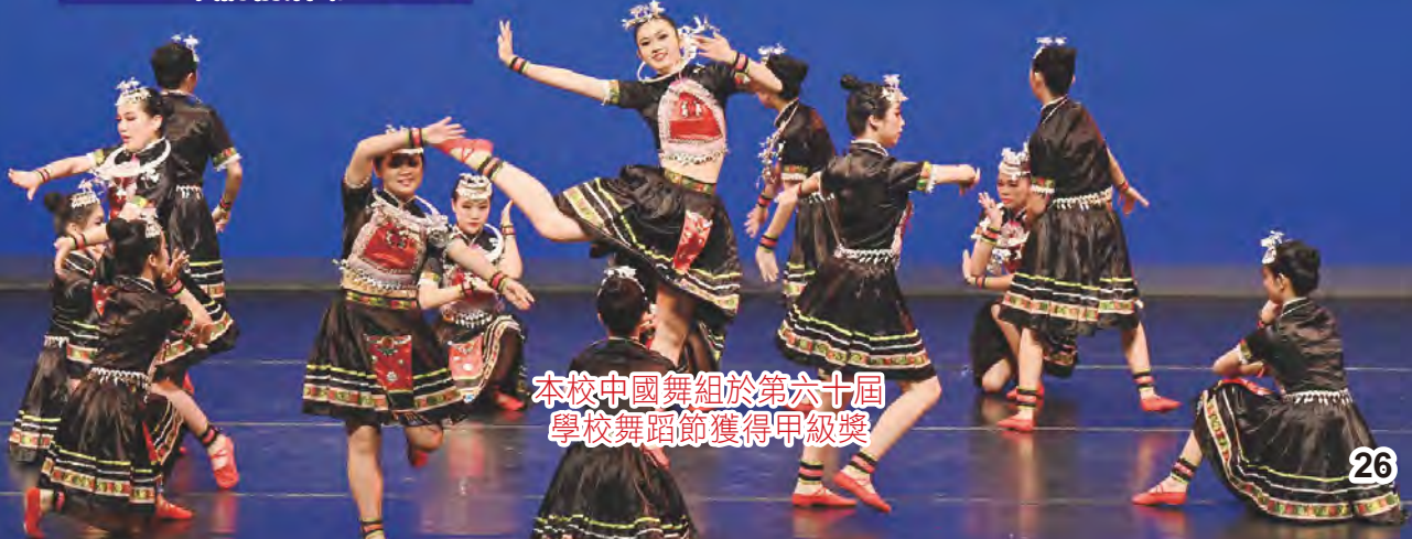
本校中國舞組於第六十屆 學校舞蹈節獲得甲級獎