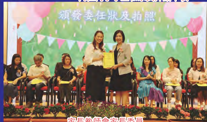
家長教師會家長委員