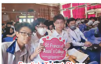
English Talent Show