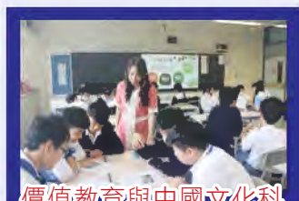
價值教育與中國文化科 課堂的分組討論