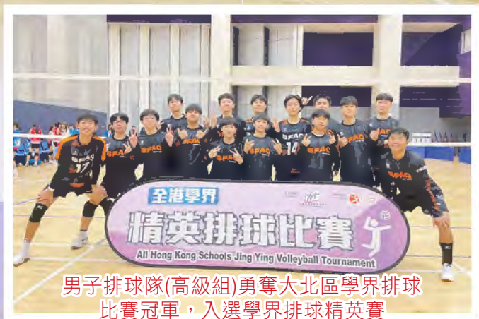
男子排球隊(高級組)勇奪大北區學界排球 比賽冠軍，入選學界排球精英賽