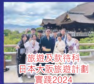
旅遊及款待科 日本大阪旅遊計劃 實踐2024