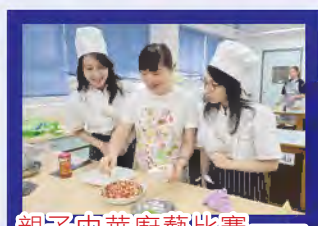
親子中華廚藝比賽—— 家長煮出經典湖南菜式「剁椒蒸龍刺」