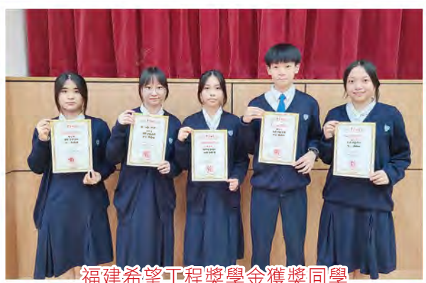
福建希望工程獎學金獲獎同學