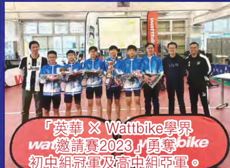
「英華×Wattbike學界邀請賽2023」勇奪初中組冠軍及高中組亞軍。