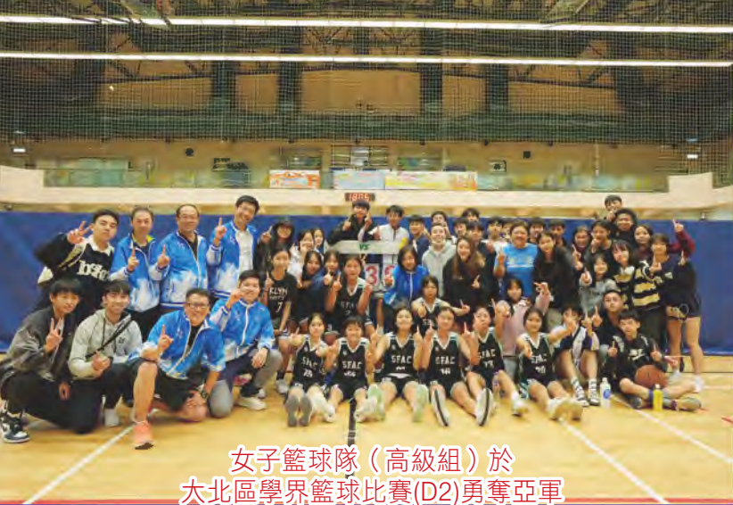
女子籃球隊（高級組）於 大北區學界籃球比賽(D2)勇奪亞軍