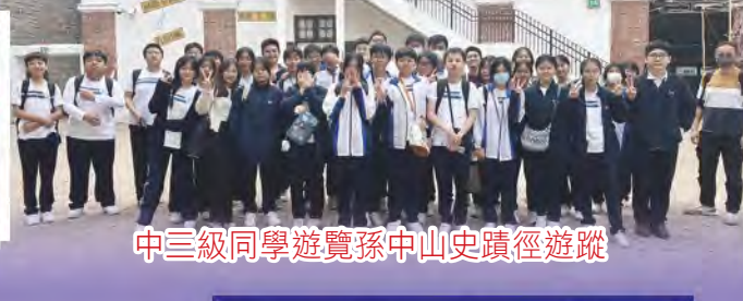
中三級同學遊覽孫中山史蹟徑遊蹤