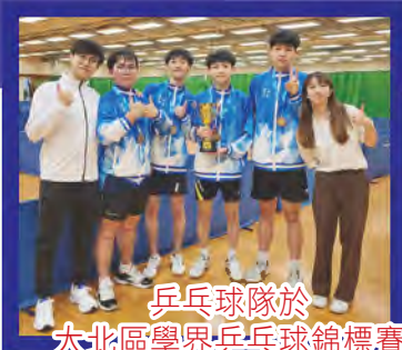
乒乓球隊於 大北區學界乒乓球錦標賽 奪得男子甲組季軍

學校注重學生體育方面的發展，為使同學的校園生活得到多元及平衡的發展，本校設有田徑隊、籃球隊、足球隊、乒乓球隊、排球隊、劍擊隊、羽毛球小組等。