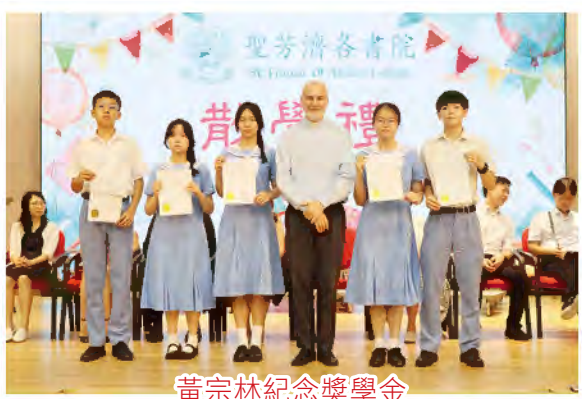
黃宗林紀念獎學金