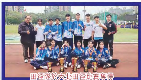
田徑隊於大北田徑比賽奪得 女甲團體第五名及男乙團體第五名