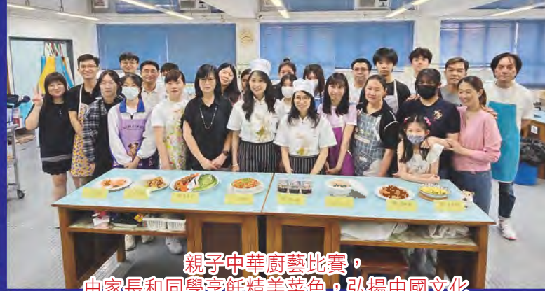
親子中華廚藝比賽， 由家長和同學烹飪精美菜色，弘揚中國文化