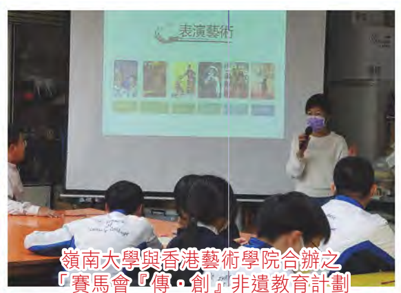
嶺南大學與香港藝術學院合辦之 「賽馬會『傳·創』非遺教育計劃