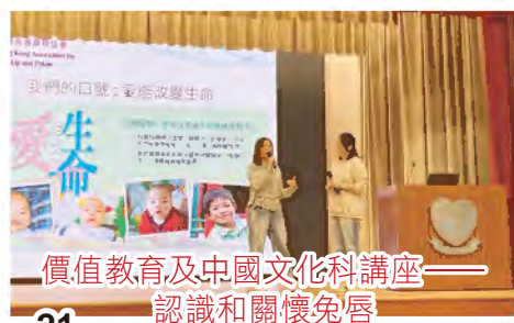
價值教育及中國文化科講座—— 認識和關懷兔唇