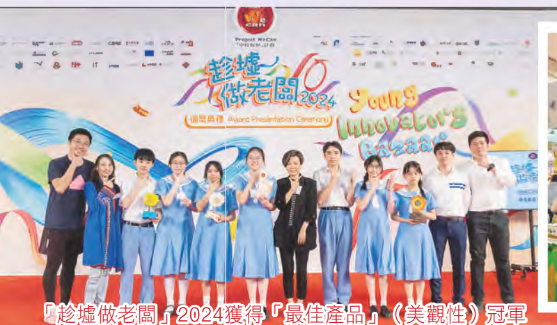
「趁墟做老闆」2024獲得「最佳產品」（美觀性）冠軍