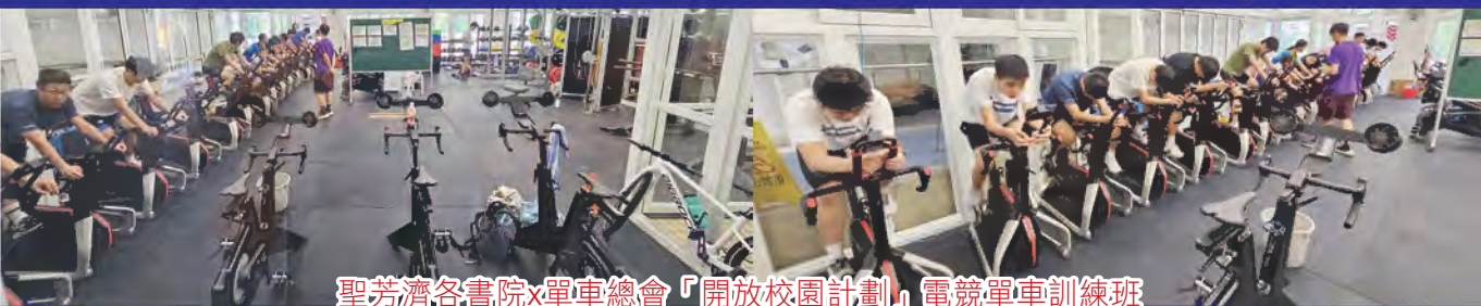
聖芳濟各書院x單車總會「開放校園計劃」電競單車訓練班