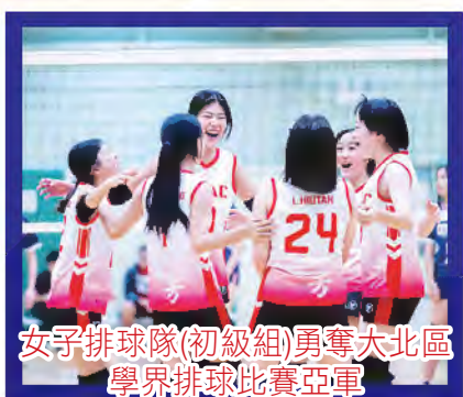
女子排球隊(初級組)勇奪大北區學界排球比賽亞軍