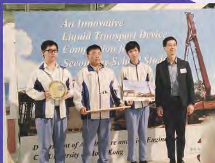
STEAM Team have won the first runner-up in the Innovative Liquid Transport Device Competition for Secondary School Students