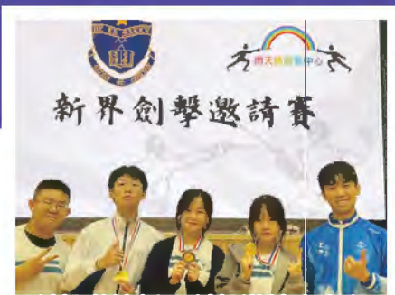
劍擊隊於新界劍擊邀請賽奪得 女子乙組重劍冠軍、 季軍及男子丙組重劍冠軍