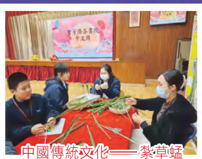
中國傳統文化——蔡草蜢