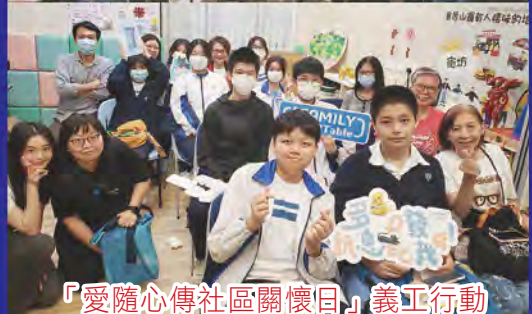
「愛隨心傳社區關懷日」義工行動