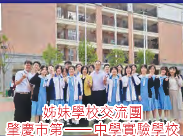
姊妹學校交流團 肇慶市第一中學實驗學校