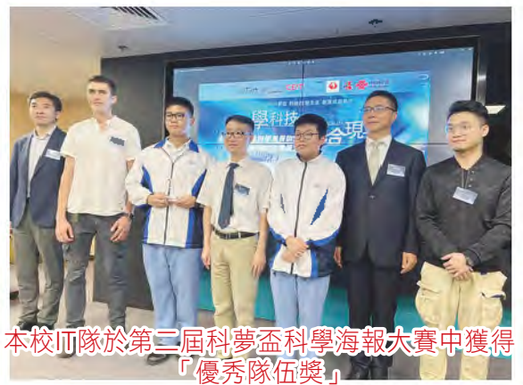
本校IT隊於第二屆科夢盃科學海報大賽中獲得 「優秀隊伍獎」