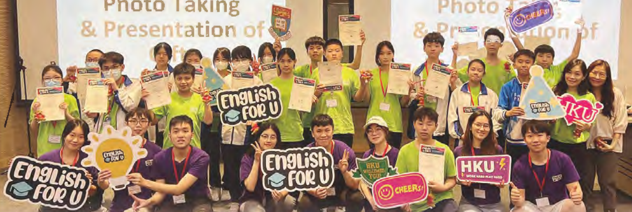
HKU English for U Language Enrichment Camp for Junior Secondary School Students