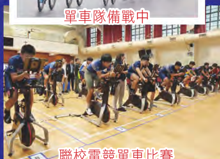
聯校電競單車比賽