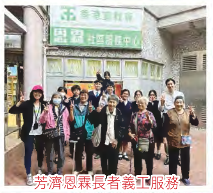
芳濟恩霖長者義工服務