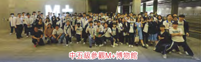
中五級參觀M+博物館