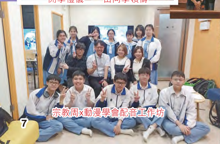
宗教周x動漫學會配音工作坊