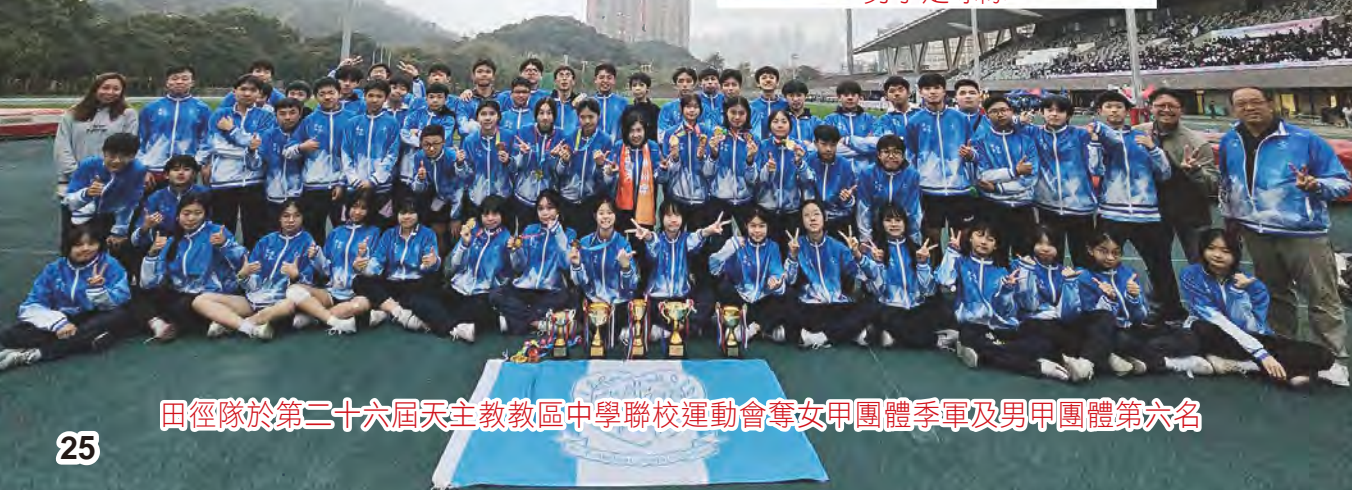
田徑隊於第二十六屆天主教教區中學聯校運動會奪女甲團體季軍及男甲團體第六名