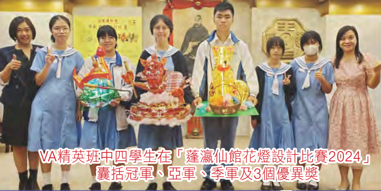
VA精英班中四學生在「蓬瀛仙館花燈設計比賽2024」 囊括冠軍、亞軍、季軍及3個優異獎