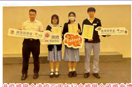
港燈獎學金港燈百周年紀念獎學金頒獎典禮