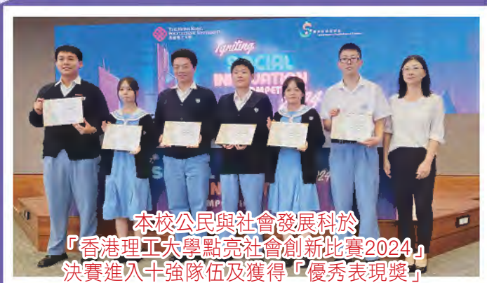
本校公民與社會發展科於 「香港理工大學點亮社會創新比賽2024」 決賽進入十強隊伍及獲得「優秀表現獎」