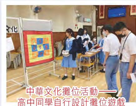
中華文化攤位活動——高中同學自行設計攤位遊戲