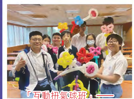
「互動扭氣球班」——透過扭氣球的技巧，強化學生的專注力及增加學生的自信心