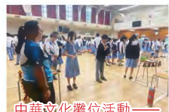
中華文化攤位活動—— 投壺