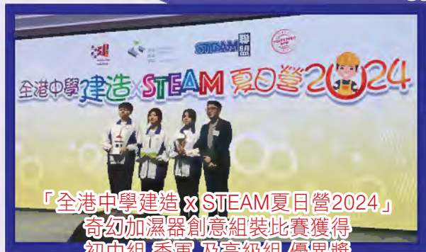
「全港中學建造 x STEAM 夏日營2024」 奇幻加濕器創意組裝比賽獲得 初中組 季軍 及高級組 優異獎