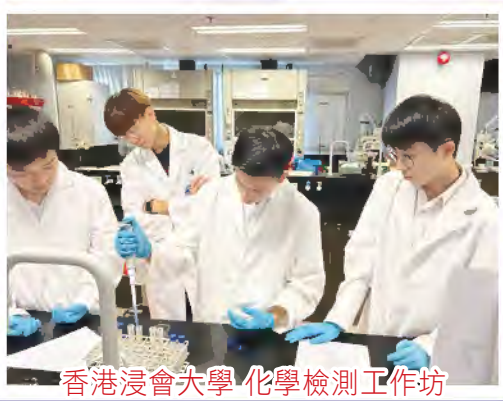
香港浸會大學 化學檢測工作坊

本校安排同學參與不同大專院校課程及活動，既能讓同學 增強學科知識，也能讓同學及早加深對大學的了解。