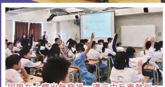
同學在「癮出無窮禍」講座中反應熱烈，能了解吸毒的禍害，遠離毒品

本校著重培育學生的個人修養及品德發展，通過不同活動，例如多元智能挑戰營、學長訓練營、生涯規劃活動和分享講座等，讓學生建立自信和目標，學會欣賞自己；又透過參加懲教署「思囚之路」活動、訓輔組銷過計劃等，培養同學承擔責任及自省自新的能力。