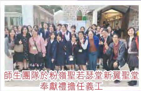
師生團隊於粉嶺聖若瑟堂新翼聖堂奉獻禮擔任義工