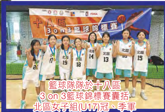
籃球隊於十八區 3 on 3籃球錦標賽囊括 北區女子組(U17)冠、季軍