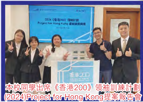
本校同學出席《香港200》領袖訓練計劃(2024)Project for Hong Kong提案報告會