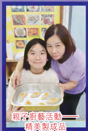
親子廚藝活動—— 精美製成品