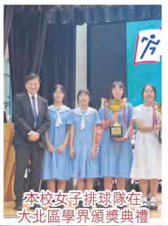
本校女子排球隊在大北區學界頒獎典禮