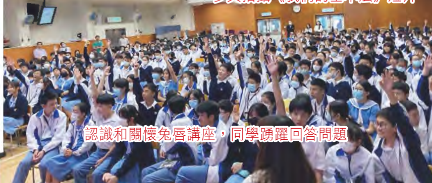
認識和關懷兔唇講座，同學踴躍回答問題