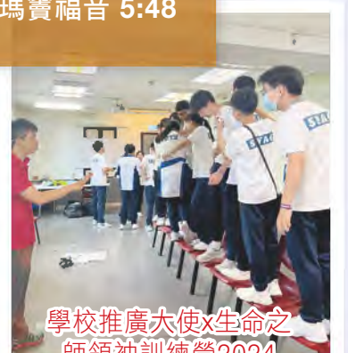
學校推廣大使x生命之師領袖訓練營2024