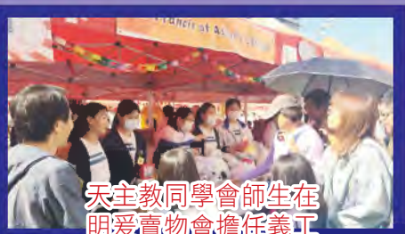
天主教同學會師生在明愛賣物會擔任義工