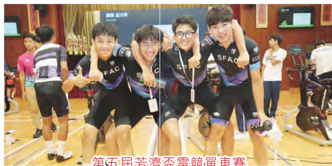
第五屆芳濟盃電競單車賽