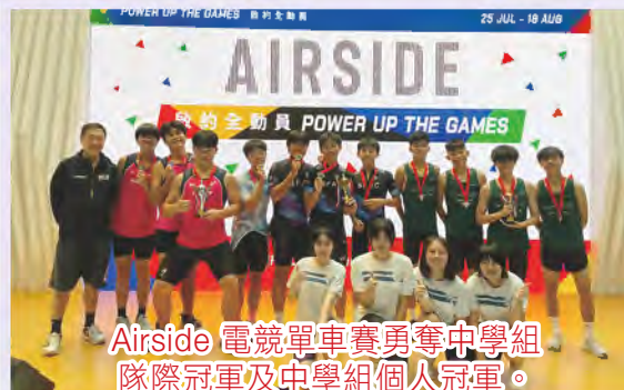
Airside 電競單車賽勇奪中學組 隊際冠軍及中學組個人冠軍。