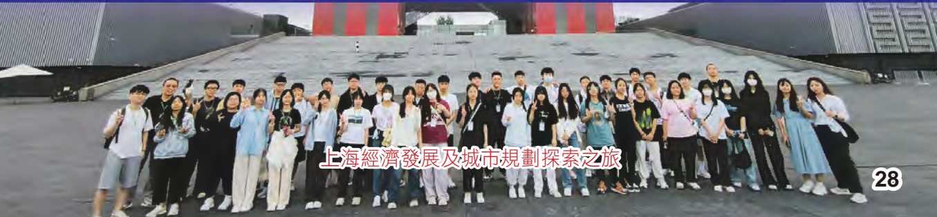
上海經濟發展及城市規劃探索之旅