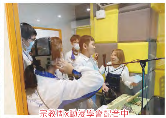
宗教周x動漫學會配音中