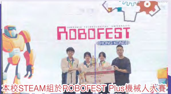
本校STEAM組於ROBOFEST Plus機械人大賽 中獲得Bottle Zumo高級組 冠軍