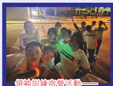
領袖訓練宿營活動——山路夜行