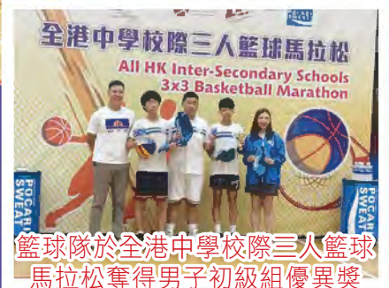
籃球隊於全港中學校際三人籃球 馬拉松奪得男子初級組優異獎