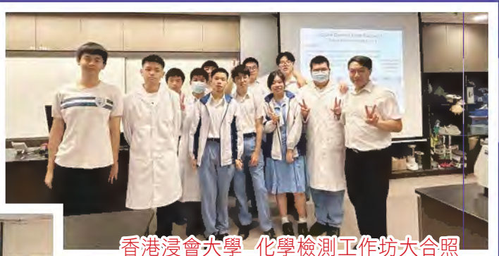
香港浸會大學 化學檢測工作坊大合照