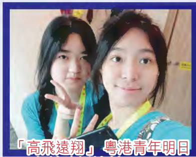
「高飛遠翔」粵港青年明日領袖培訓計劃2024，本校同學到廣州交流