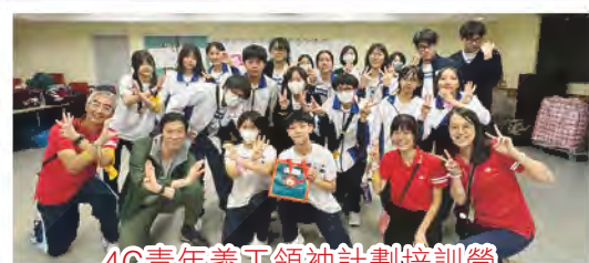
4C青年義工領袖計劃培訓營