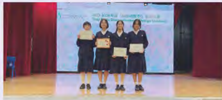
「向歧視說不!」設計比賽 視藝精英班在愛滋寧養服務 協會舉辦「面具設計比賽 2023-24」獲得佳績