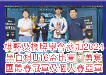
棋藝及橋牌學會參加2024 黑白棋U16盃比賽，勇奪 團體賽冠軍及個人賽亞軍

本校透過不同範疇的活動，讓學生盡展所長，發揮個人潛能。在朗誦、運動、話劇、舞蹈和音樂方面，均有出色的表現，更取得不少獎項。