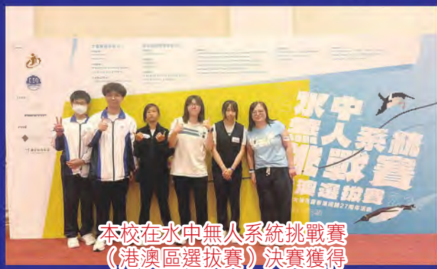
本校在水中無人系統挑戰賽 (港澳區選拔賽) 決賽獲得 「大灣區科技創新團隊獎」及 「優秀表達團隊獎」